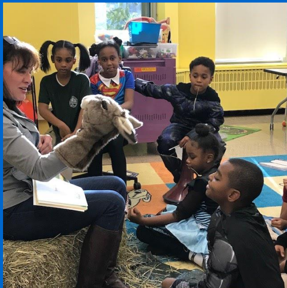
Chương trình Người bạn của Nông trại P.A. Thư viện Shaw