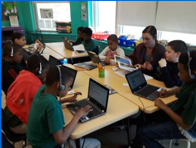
Programación, Biblioteca P.A. Shaw