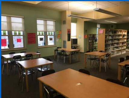
Renovación de la biblioteca de la Mildred Avenue K-8 School