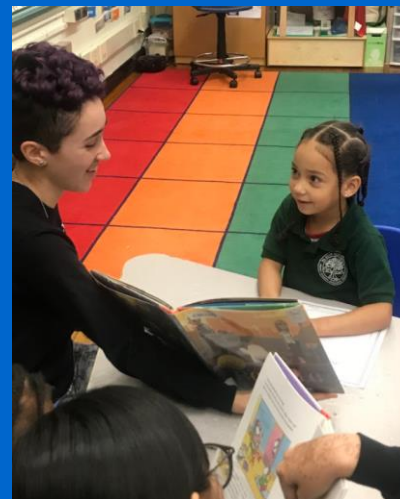
Alunos sênior BLS na P.A. Shaw