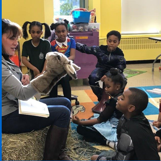
Farm Friends Program (Pwogram Zanmi Fèm P.A. yo) P.A. Bibliyotèk Shaw