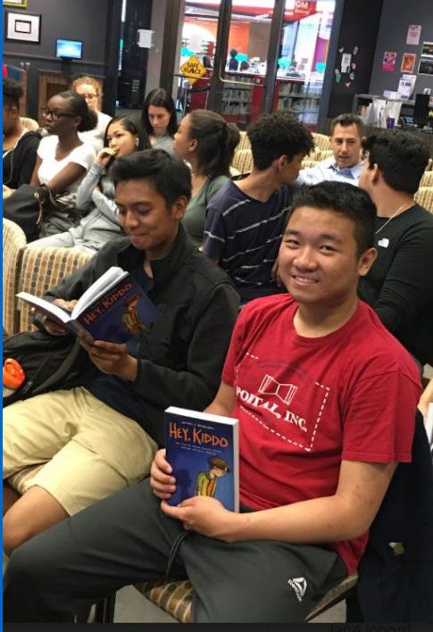
Visite de O'Bryant Author : Hey, Kiddo de Jarrett J. Krosoczka (finaliste du National Book Award)