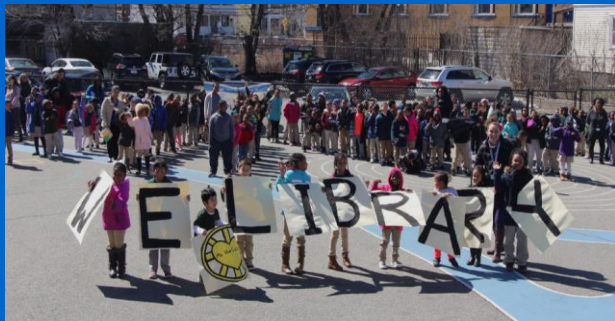
Dia Nasiunal di Bibliutekáriu Skular P.A. Skola Primáriu Shaw