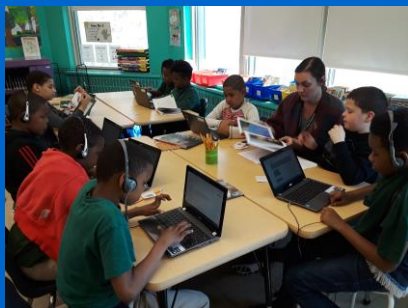
Kudifikason, P:A: Bibliuteka Shaw