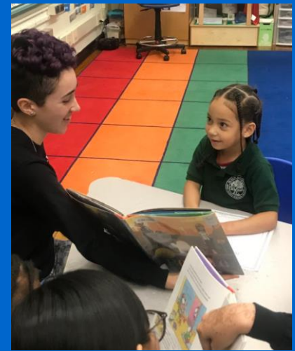
BLS Seniors na P.A. Shaw